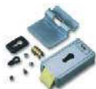
PLA 10 zamek elektromagnetyczny pionowy

inne dodatkowe akcesoria - patrz strony 66 - 73