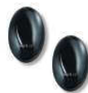
BF fotokomórka (para) zasięg 15-30m