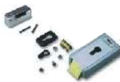
PLA 11 zamek elektromagnetyczny poziomy