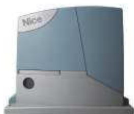
ROBUS350 silownik z wbudowaną centralą sterującą BLUEBUS